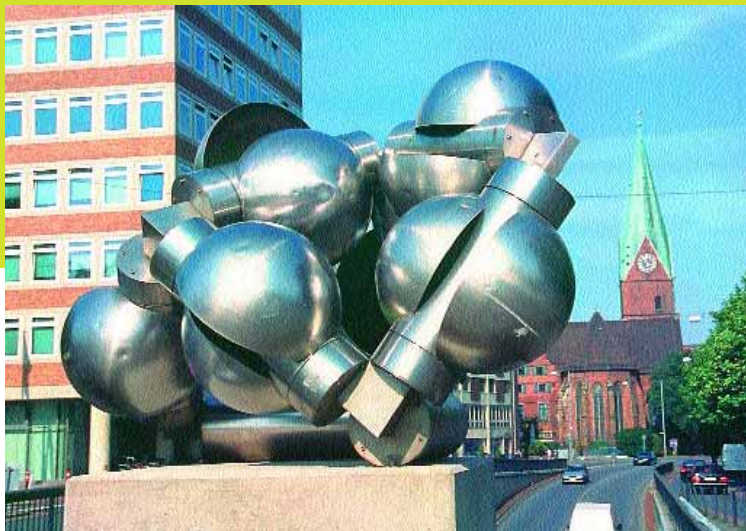
Hein Sinken: Kinetisches Objekt, 1973.

Zach: Bei Kunst im öffentlichen Raum tritt aktuell zutage, dass die Praxis nicht vernünftig geregelt ist. Die Kunst im öffentlichen Raum ist auf eine Art Abstellgleis geschoben, wo das Ganze noch so eben funktioniert. Wenn die zur Verfügung gestellten Summen über 25 Jahre annähernd konstant bleiben, dann ist das real mindestens eine Halbierung. Es gibt einen symbolischen