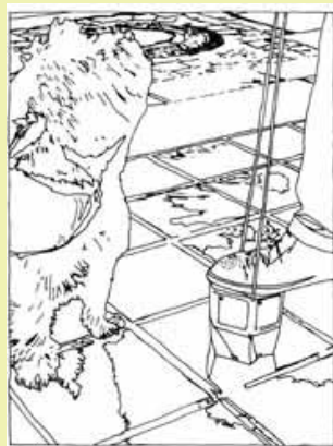
Christian Meyer: Hundekotentferner, 2003

Zu dieser Ausstellung ist ein kleiner aber feiner Katalog erschienen, der in der DKV erworben werden kann. Kontaktadresse: DKV-Residenz, Am Wandrahm 40-43 28195 Bremen, Fon: 0180-115 52 00 www.dkv-residenz-contrescarpe.de