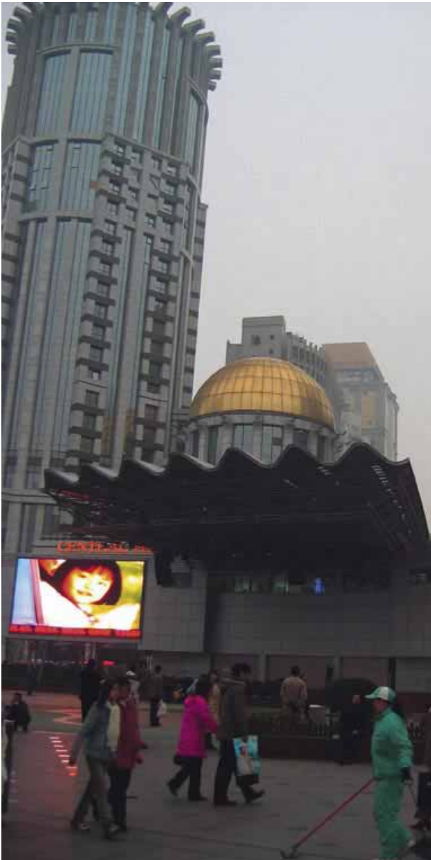
Nanjing Lu, Shanghais Hauptgeschäftsstraße mit ihren flirrenden, blinkenden Neonreklamen, Foto: Natascha Ahrens