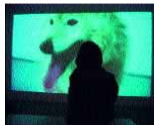
ich als reh vor dem stummfilm „departure“ von mircea cantor