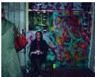
aufsicht vor graffiti-lokalkolorit in der jüdischen mädchen-schule

der garnisonsfriedhof, auf dem ich zufällig das grab von friedrich de la motte fouqué fand, während ich dem wundersamen gesang „follow me“ von susan philipsz folgte. der spiegelsaal im ballhaus mitte, von goebbels als offizierskasino benutzt, unter dessen ver-welkter kuppel sich nun als lebendige dauer-schleife ein liebespaar drehte und wand, während es von zeit zu zeit den werktitel hauchte: tino sehgal „the kiss“ 2002. die ironie einer gogosian gallery aus der retorte, die ihren winzigen vor- und zwischen- und nebenraum in einer gruppenausstellung glücklich feierte. die pferdeställe des post-fuhramts, wo pawel alt-hamer ganz hinten an der wand einen einzigen turnschuh hinterließ: „fairytale“: mit althamers unterstützung soll das märchen wahr werden, dass eine illegal in berlin lebende einwanderin eine aufenthalts-ge-nehmigung erhält. und schließlich am ende der august-straße die st. johannes-kirche, die von kris martin zur flughafenhalle unfunktioniert worden war. subtiler und phantastischer hätte ich mich allerdings ins nirwana katapultieren können, wäre ich vom bloßen geklapper der buchstabenplättchen einer fiktiven anzeigetafel beschallt worden in einer ansonsten leeren kirche.