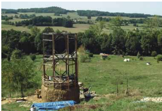
„Kunst im Rhythmus der Natur: Zwischenstand 2005“

Ein Dorf ist keine Stadt. Einer siedelt und baut, einer gräbt und gründet, jemand stellt sein Ziel wohin. Aus der Ferne faucht ein alter Traktor heran, schleppt einen Bauwagen, und schon ist man wieder einer mehr. Erst hüpfte man über Brennnesseln, um sich zu besuchen, dann wachsen Trampelpfade zwischen den Häuschen, Hütten und Erdlöchern, und eines Tages trifft man sich zum großen Ratschlag: Was tun wir mit dem Zwischenraum? Ein Stück gestampften Lehms, ein paar Meter Buchsbaumhecke, eine Rose, die täglich Wasser braucht – das könnte schließlich der Anfang von etwas sein. Von etwas Kommunalem. Vielleicht sogar von etwas Sozialem.