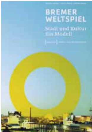
Das Buch Bremer Weltspiel, Stadt und Kultur, Ein Modell - 245 S. m. zahlr. Farbbabb., transcript, 2006, ISBN: 3899424859, 22,80 Euro

Dazu können Künstler gerne Künstler sein. Sie sollten sich nur auch für Gärtner, Unternehmer, Homöopathen und andere Städter interessieren.