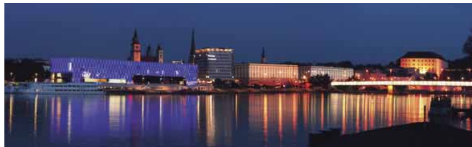
Linz am Rhein: Foto: Archiv TVB Linz

In Linz beginnt's ! So lautete ein Claim, mit dem Linz sich in der jüngeren Vergangenheit als eine Stadt vorgestellt hat, die offen ist für Innovation.