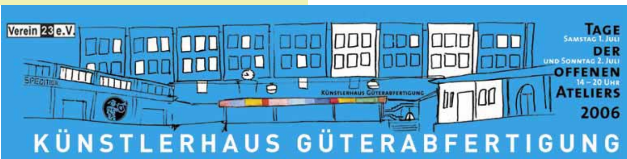
Tag der Offenen Ateliers, Sa./So. 1. bis 2. Juli, 14-20 Uhr, Ort: Künstlerhaus Güterabfertigung, 28195 Bremen, Am Güterbahnhof, infos unter: www.ga-art.de

Serielle Arbeit Kunstverein Stade ehemaliges Schloßhaus, Altländerstr. 2 Ort: 05193 99121, tägl. 10 - 18 Uhr, auch montags Eröffnung: 6. August 2006, 11 Uhr Ausstellungsdauer: bis 27. August 2006