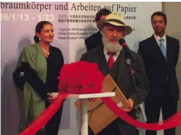
Gotthard Graubner während der Eröffnung der Ausstellung im Shanghai Art Museum, Foto: Natascha Ahrens

Shanghai umfängt uns sofort mit seinem atemberaubenden Tempo: über die Autobahn rasen wir durch die Hochhausinsiedlungen der Vorstädte. Dem stoischen Gesicht des Taxi-fahrers ist nicht zu entnehmen, ob er etwaige Hindernisse wahrnimmt. Er bremst jedenfalls möglichst nicht, sondern umkurvt Behinderungen mit geringstmöglichem Abstand. Links überholt uns der Transrapid.