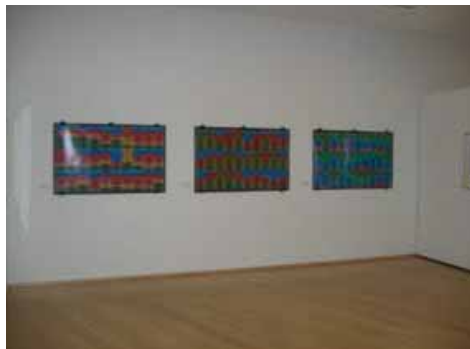
Blick in die Ausstellung, 2007