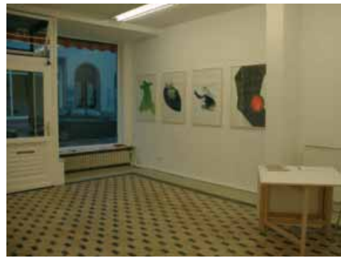
Der Galerieraum, Foto: Florian Wieneck