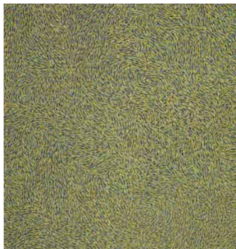
Gerda Henning, o.T., Öl auf Leinwand, 125 x 120 cm, 1995

gerda henning rauchte gern, hatte rotes haar und sommersprossen, ihre haut war durchscheinend und zart, die hände langgliedrig. sie sah gern fern und meinte, das käme daher, dass sie bildersüchtig sei. sie hatte einen spröden, trockenen humor und sagte unumwunden und direkt, was sie dachte. ihre augen: ein besonders helles grau mit stecknagelgroßen pupillen. wenn sie einmal nicht malte, strickte sie sich mohairpullover in den schönsten und gewagtesten farben, altrosa, resedagrün, rost- und fliederfarben. auf diese weise war auch sie selbst oft ein wunderbares bild.