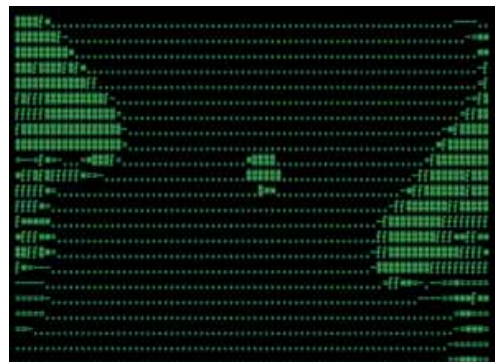
Olaf Schultz, Tropfeninfektion, Filmstill einer Computerinstallation, 1999, Foto: Olaf Schultz