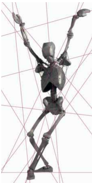
Der schöne Mann

Die Ausstellung zeigt 20 Skulpturen, 35 Zeichnungen und diverse Archivalien. Es erscheint ein Katalog zum Preis von 18 €. Ausstellungsdauer: 10.06. - 12.08.2007 Gerhard-Marcks-Haus, Am Wall 208, 28195 Bremen