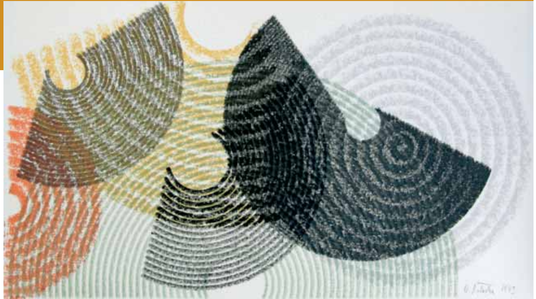
Anna Solecka, o.T., Material: Buntstift, Kreide, Plotter auf Papier, 25 x 43 cm, 1989

zeitung des bremer verbandes bildender künstlerinnen und künstler | ausgabe 22