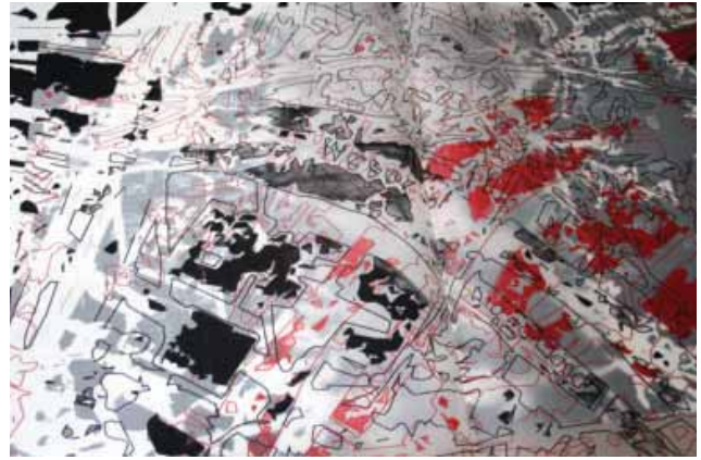
Udo Reichwald, Pictor »Haut der Stadt« (Ausschnitt), 1994, Siebdruck auf Basis computergenerierter graphischer Daten, Foto: Udo Reichwald

Hans-J. Müller - Ich zeig's euch mal ... Ausstellungsdauer: 06.06. - 15.07.2007