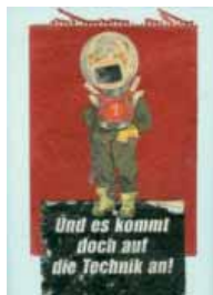
Gertraud Schlesing »und es kommt doch auf die Technik an«

»Venuskomplex – Bilder und Objekte von Gertraud Schlesing« Kontorhaus an der Schlachte, Schlachte 45, 28195 Bremen bis zum 27. März 2009