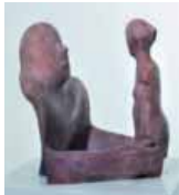
Waldemar Otto »Bildhauer mit Frau«

»Keine Retrospektive« – Waldemar Otto Gerhard-Marcks-Haus, Am Wall 208, 28195 Bremen 8. März bis 10. Mai 2009