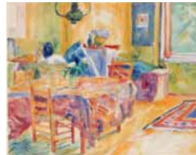
Heinrich Nauen »Winterkurs«

Lebenswelten Stillleben, Interieur und Kunsthandwerk im Expressionismus Städtische Galerie Delmenhorst, Fischstr. 30, 27749 Delmenhorst bis zum 26. April 2009