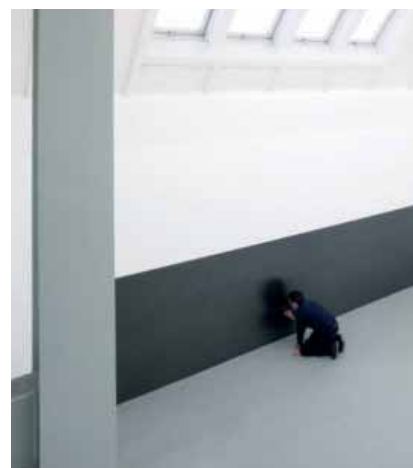
Frank Gerritz, Lowdown, 2008

Kunsthalle läuft vom 31. 1. bis zum 10.5. 2009 eine Ausstellung, die das künstlerische Umfeld der Band zum Thema hat: »Sonic Youth etc: Sensational Fix«. Aber Sonic Youth kommen trotz neuer Platte im Sommer, wohl wieder nicht nach Bremen. Deshalb sollten aber alle den Weg zu Wire in die SPEDITION am 21. März finden.