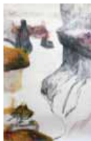
Ralf Tekaart »canyon«

»Above us only sky« – Ralf Tekaart Kunstverein Cuxhaven, Segelckestr. 25, 27472 Cuxhaven bis zum 15. März 2009