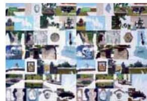
Krzysztof Wróblewski, Vita Somnium breve – Grabmal für Walerjan Wróbel, aus der Serie »Isoformen«