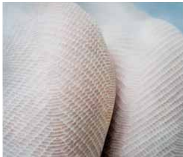
Marina Schulze, e.T./SB VIII 2006, Acryl und Öl auf Leinwand, 120 x 140 cm; Foto: Frank Scheffka