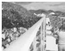
Aus der Arbeit der Wiener Architektin Gabu Heindl: »bin city Las Vegas«

Informationen zu den KünstlerInnen, ihren Arbeiten und zum Programm gibt es auch auf der Projekt-Homepage www.touristcity.de .